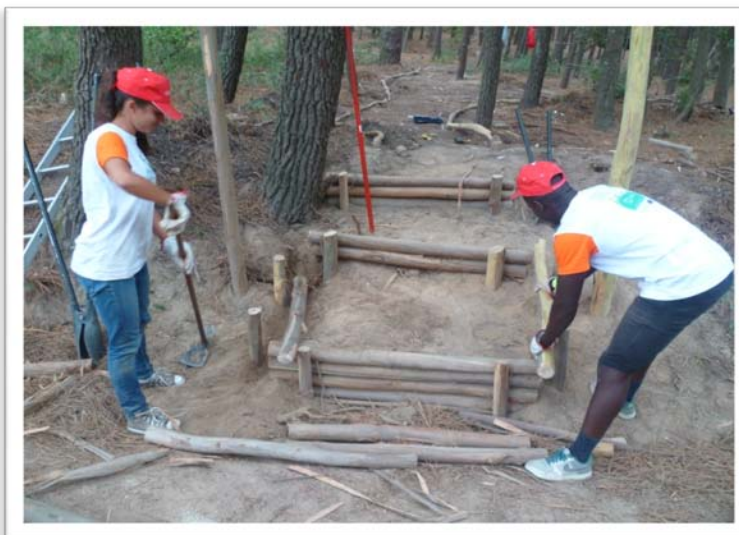
Fig. 11 - Construção de degraus em madeira.