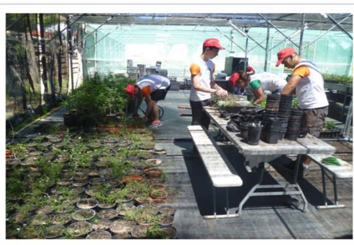
Fig. 3 - Trabalhos de repicagem.