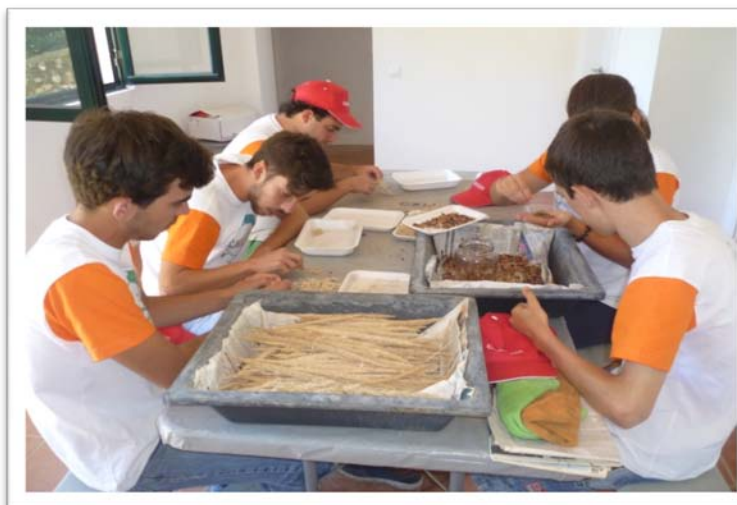
Fig. 2 – Limpeza de sementes.

OBJETIVO → Ajudar nos trabalhos diários do BGVA, que fornece plantas para ações de plantação e recuperação da paisagem natural e promove assim uma floresta sustentável, respeitando o fundo genético do PNSC.