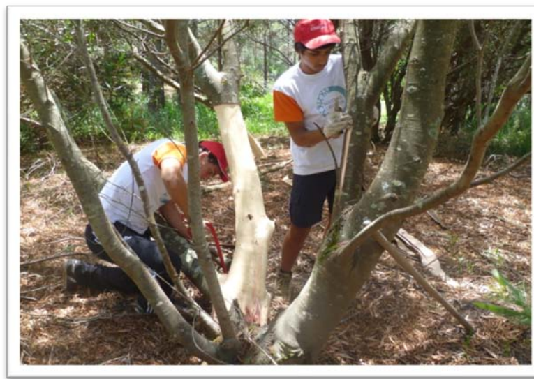
Fig. 5 – Descasque de acácias.