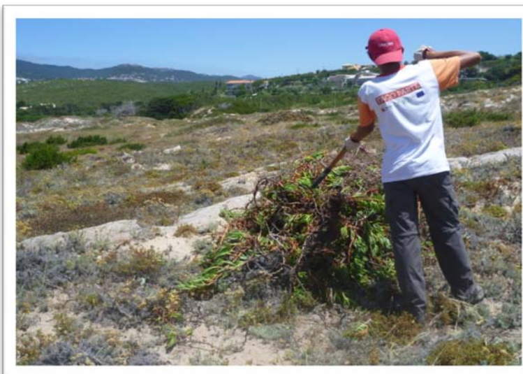
Fig. 7 – Empilhamento de chorão arrancado.