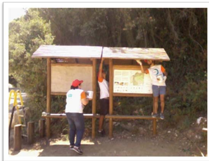
Fig. 2 – Limpeza de painéis informativos.