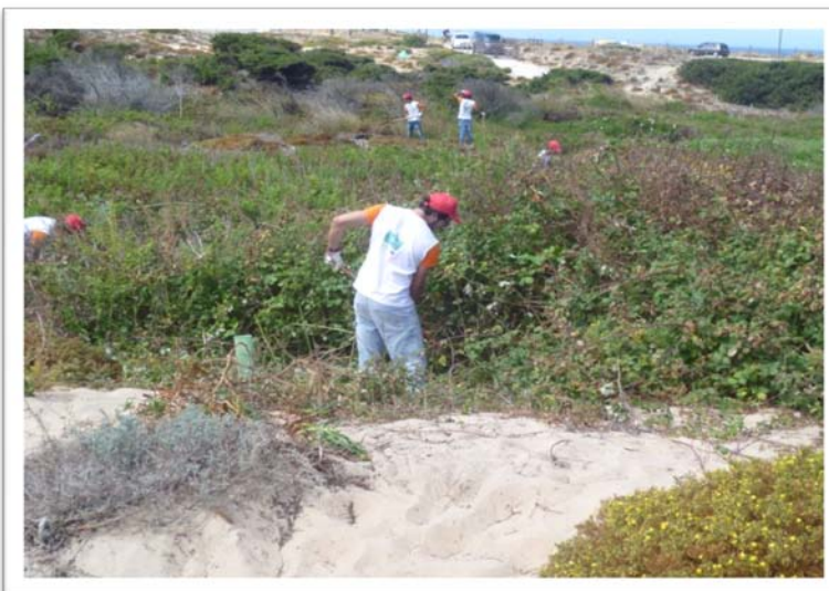
Fig. 6 - Corte de silvas para beneficiar as plantas dunares.

OBJETIVO → Requalificação e estabilização do cordão dunar Cresmina-Guincho e orla costeira através de ações concretas de gestão ativa do habitat.