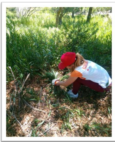
Fig. 4 – Arranque manual de acácias.

OBJETIVO → Gestão florestal, no apoio à regeneração da vegetação natural e na redução do risco de incêndio, em áreas distintas: Quinta do Pisão – Parque da Natureza e Perímetro Florestal da Serra de Sintra (PFSS).