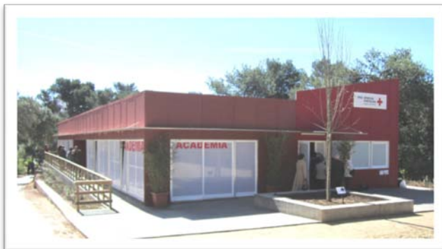
Fig. 1 - Academia Sénior da Cruz Vermelha no Parque Urbano da Ribeira dos Mochos.