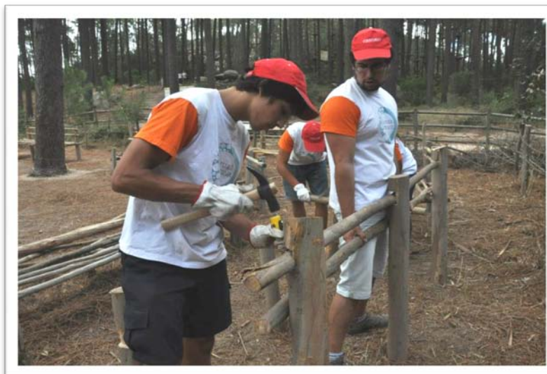
Fig. 10 – Construção de banco em madeira.

OBJETIVO → Apoiar na construção e/ou manutenção de estruturas de madeira necessárias à execução de atividades (ex.: Campos Sioux) e beneficiar a regeneração da vegetação natural no PACB.