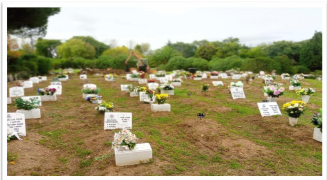
Sepulturas temporárias – Covais