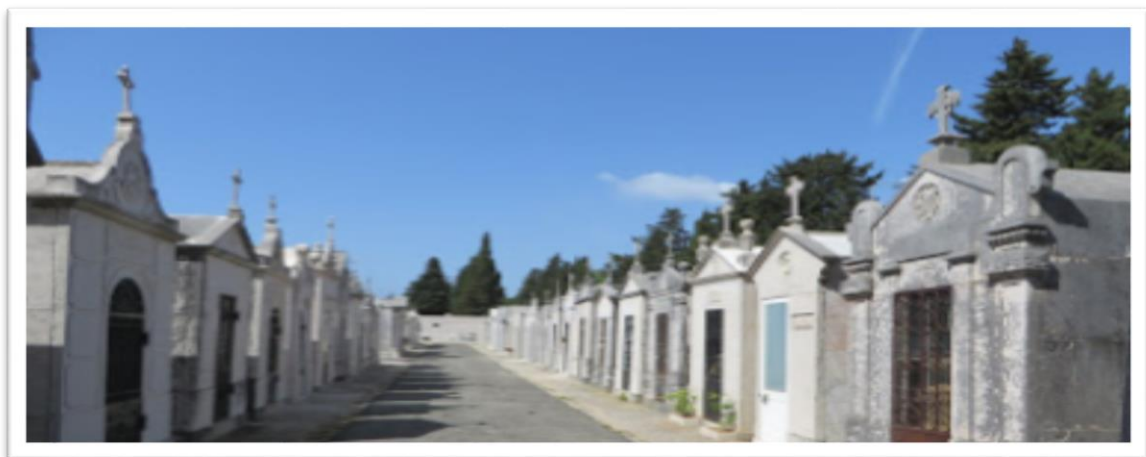
Jazigos particulares (tipo capela)