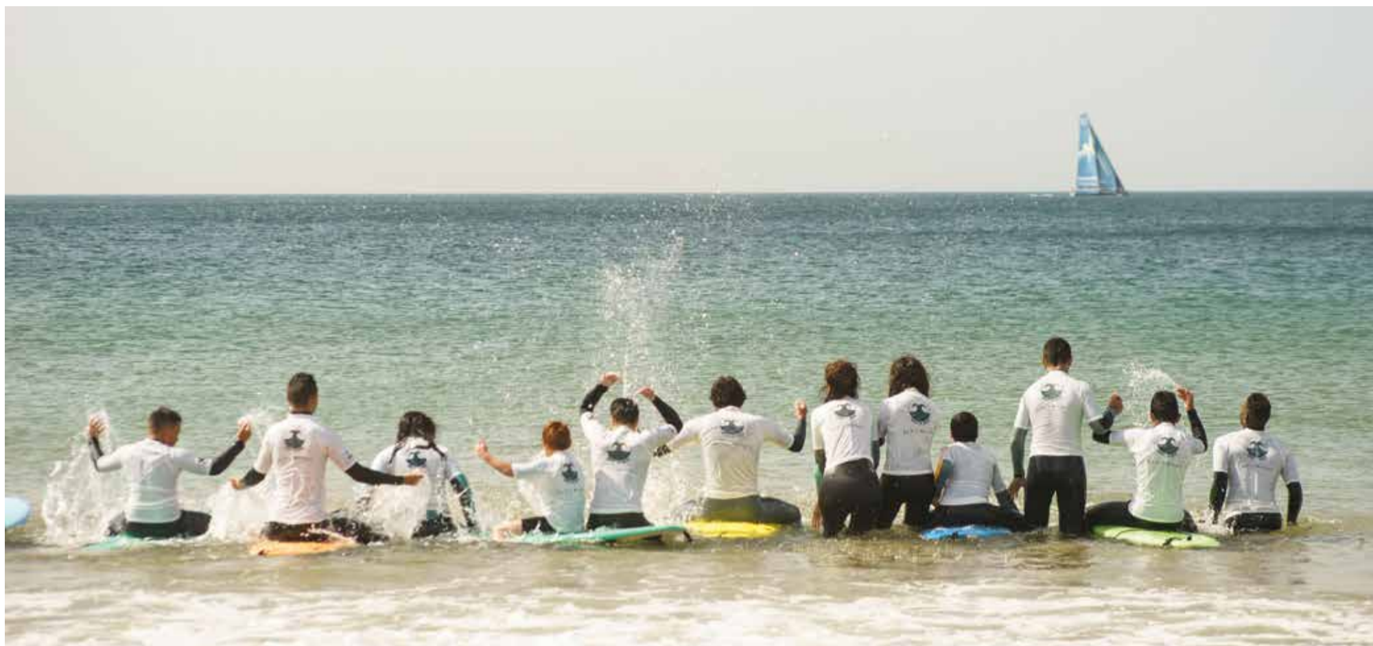
As praias de Cascais são o local de excelência para as escolas de surf que nelas formam campeões para o desporto e para a vida