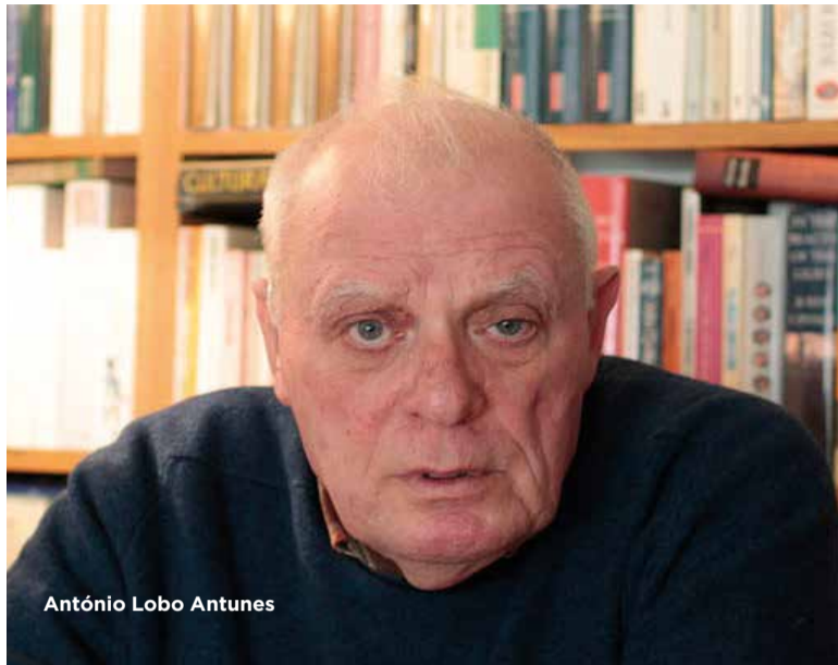
António Lobo Antunes